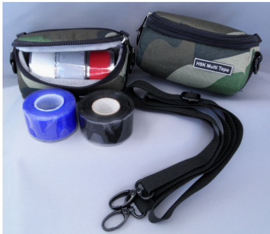
<ケースにはショルダーストラップ付き>