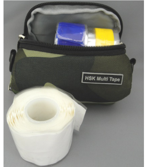
<ケース、テープセット例1>