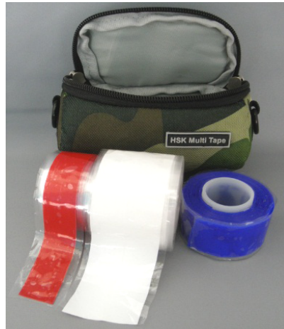
<ケース、テープセット例2>